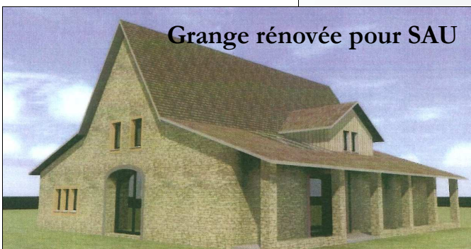
Grange rénovée pour SAU