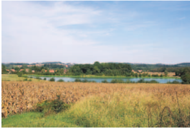
Le lac Lahittète

Le lac de Biron, retenue artificielle de 45 hectares, à cheval sur la commune d'Orthez, doit sa naissance